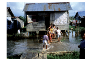
Familie vor ihrem Haus in den Slums

Gleichzeitig erfahren sie etwas über die Probleme in diesem Land und die von Dülmen geleisteten Hilfen.