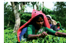
Teepflückerinnen in Sri Lanka

Wo kommen die Produkte her? Wer bekommt das Geld für die produzierte Ware? Neben Informationen zu Herkunft und Anbau fair gehandelter Produkte, können die TeilnehmerInnen Wein, Kaffee, Cappuccino, Tee, Schokolade, Gebäck, Trockenfrüchte und Honig probieren.