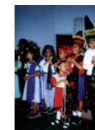
Patenkinder in der Sonntagsschule

Die Referentin gibt einen Einblick in dessen interessante Kultur und erzählt von eindrucksvollen Erlebnissen mit den liebenswerten Menschen dort. Gleichzeitig erfahren Sie etwas über die Probleme in diesem Land und die von Dülmen geleisteten Hilfen.